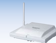
KX-TDA0158 Station cellulaire à 8 canaux