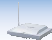
KX-TDA0155 Station cellulaire à 2 canaux